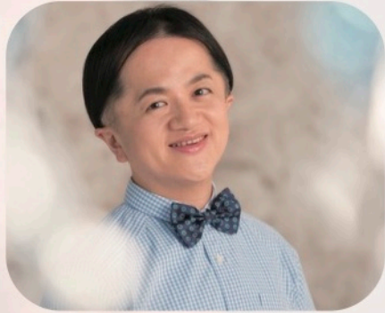
米良美一(カウンターテナー) Mera Yoshikazu

2019年デビュー25周年を迎える米良美一は、「もののけ姫」の主題歌を歌って一世を風靡、その類まれな美声と音楽性で欧米でも高く評価されている。また、テレビやラジオ、CMにも多数出演し、親しみやすい人柄と個性豊かな語り口は、世代を越えて人気を集めている。1994年洗足学園音楽大学を首席で卒業。1995年第6回奏楽堂日本歌曲コンクール第3位入賞。1996年よりオランダ政府給費留学生としてアムステルダム音楽院に留学。国内外でのコンサートをはじめ講演会、文筆活動等幅広い活動を行っている。CDはキングレコードやスウェーデンBIS、韓国のレーベルより世界各国で多数発売されている。2014年には宮川彬良氏と「手紙」をリリース、2017年にはCDデビュー20周年を記念した2枚組のコンピレーションアルバム「無言歌」がキングレコードよりリリースされた。最近では「TeddyLoid/SILENT PLANET 2 EP vol.6 feat. 米良美一」がネット配信されている。著書に「天使の声～生きながら生まれ変わる」(大和書房)、石牟礼道子氏と「母」を出版。NHK放送90年記念大河ファンタジー・ドラマ「精霊の守り人」の出演がある。